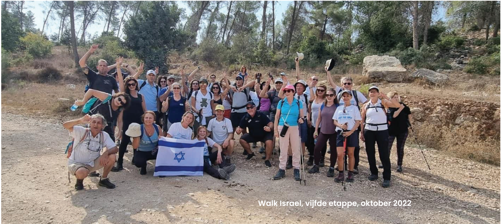
Walk Israel, vijfde etappe, oktober 2022

Van 23 tot 28 oktober 2022 werd de vijfde en laatste etappe gelopen. De start was in Netanya, de finish in Jeruzalem. De etappe werd afgesloten op een prachtige locatie: de Olijfberg met zijn panoramische uitzicht over de stad Jeruzalem.