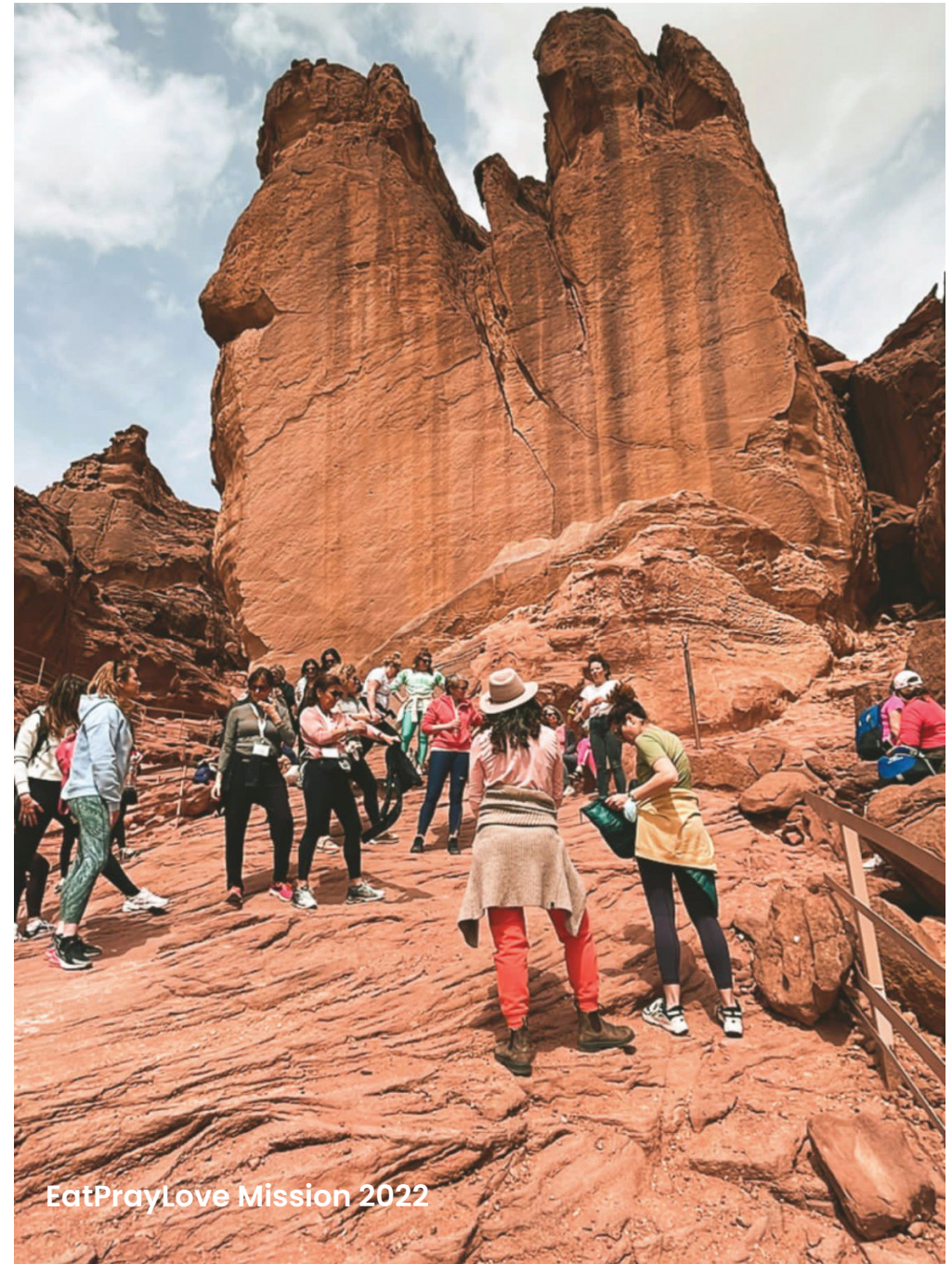
EatPrayLove Mission 2022